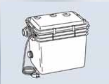
Concept DrainLift inkl. 2,5 m Anschlusskabel