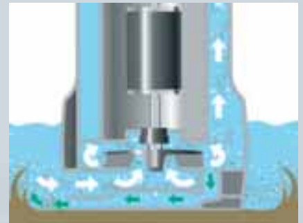
Concept Drain sorgt mit einer integrierten Wirbeleinrichtung für einen ständig sauberen Pumpenschacht

Die Tauchmotorpumpe Concept Drain pumpt Wasser aus dem häuslichen Bereich, wie z.B. Waschmaschinenlauge. Weiter ist sie bei der Entwässerung von Kellerniedergängen und Keller-räumen einsetzbar, dient der Beseitigung von Wasser nach Überschwemmungen oder auch dem Entleeren von Pools.