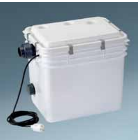
Concept DrainLift (siehe Abb. links unten)