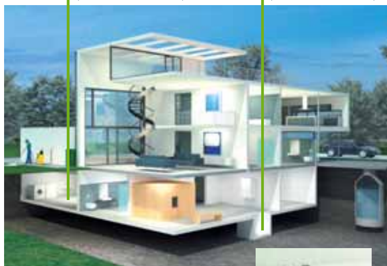
Concept Drain (siehe Abb. links oben)

Concept bietet im Bereich Wassermanagement Produkte, die Wasser filtern, Druck mindern und für mehr Effizienz, Umweltfreundlichkeit und Gesundheit rund um Ihr Wasser sorgen. Näheres dazu erfahren Sie im Prospekt „Wassertechnik-Armaturen“.