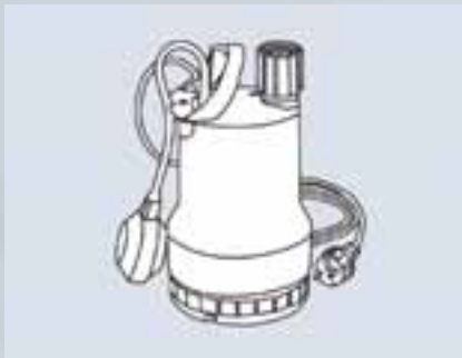
Concept Drain inkl. 3 m Anschlusskabel