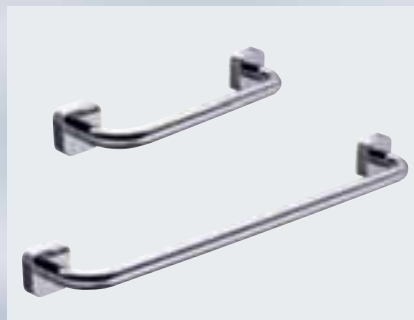
Wannengriff (Achismaß 300 mm) 002-1177; Badetuchhalter (Achismaß 600 mm) 002-1175, Badetuchhalter (Achismaß 800 mm) 002-1176