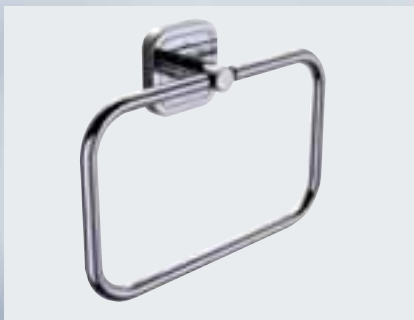
Handtuchring (210 x 153 x 44 mm) 002-1174