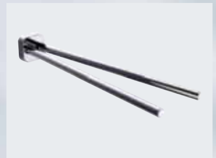
Handtuchhalter, 2-tlg., (h 57 mm, t 409 mm) 002-1173