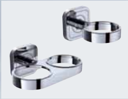
Universal-Halteelemente (passend zu Mundspülglas, Seifenschale, Seifenspender) einfach 002-1166; doppelt 002-1188