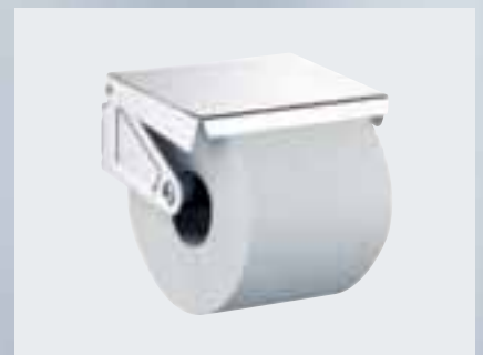
Papierhalter mit Deckel und Rolle (127,5 x 68,5 x 103,5 mm) 002-1113

Alle Metalloberflächen in hochglanz-verchromt. Größenangaben in der Reihenfolge Breite, Höhe, Tiefe, wenn nicht anders angegeben.