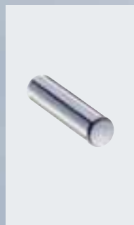
Reservepapierhalter (Ø 20 mm) 002-1163