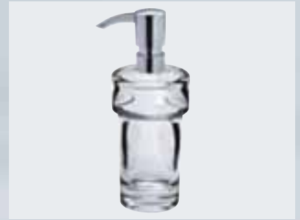
Seifenspender (Ø 64 mm, h 172 mm) mit Dosierpumpe aus Kunststoff, Spender aus klarem Kristallglas*, 002-1169