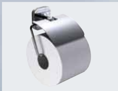
Papierhalter mit Deckel (132 x 63 x 108 mm) 002-1161; ohne Deckel (132 x 100 x 68 mm) 002-1162