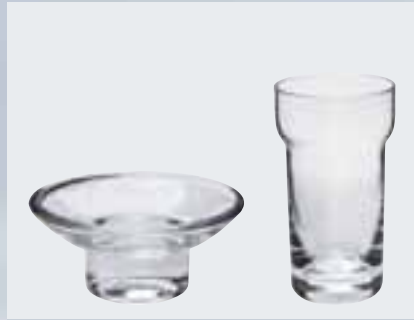
Mundspülglas (Ø 64 mm, h 115 mm) 002-1167; Seifenschale (Ø 106 mm) 002-1171, beide aus klarem Kristallglas*