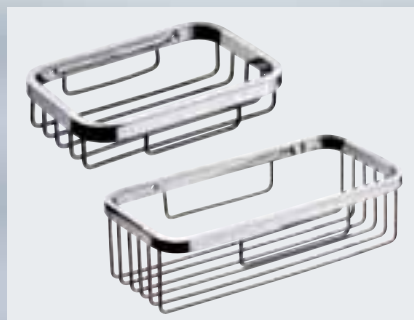
Körbe für die flache Wand Seifenkorb (135 x 32 x 90 mm) 002-1181; Wandkorb (205 x 60 x 104 mm) 002-1183