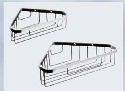
Körbe für die Ecke Seifenkorb (186 x 54 x 134 mm) 002-1182; Wandkorb (250 x 61 x 172 mm) 002-1184