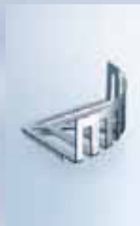
Eckwandkorb 183 x 70 x 183 mm, 010-7683