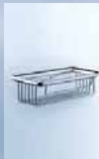
Schwammkorb* 200 x 100 x 60 mm, 010-7123