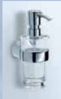
Flüssigseifenspender Einsatz Kristallglas, 010-7111