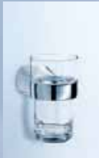
Glashalter Becher Kristallglas, 010-7110