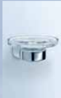
Seifenhalter Schale Kristallglas, 010-7112