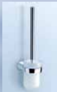
WC-Bürstengarnitur ohne Deckel, 010-7109