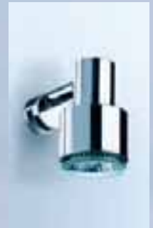
Halogen-Klemmspot integr. Transformator, 019-1199