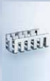
Wandkorb 217 x 70 x 94 mm, 010-7682