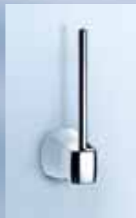
Reservepapier- Rollenhalter, 010-7108