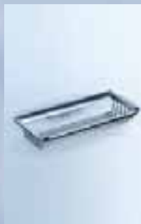
Seifenkorb* 200 x 100 x 36 mm, 010-7125