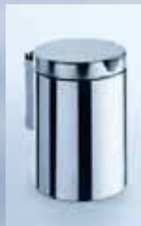
Abfallbehälter mit Deckel, 3 l Inhalt, 010-7129