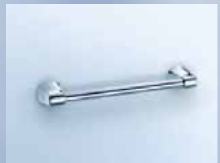
Wannengriff 300 mm (innen), 353 mm (außen), 010-7117