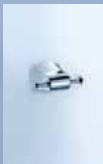
Handtuchhaken 2-teilig, 010-7118