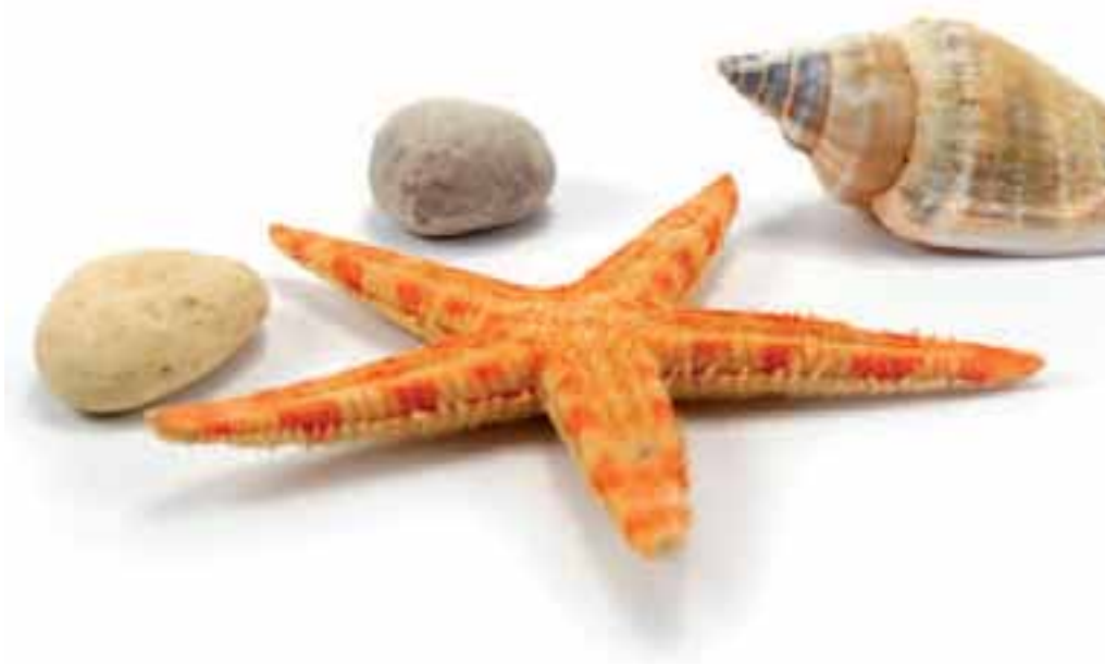
Abb. links: Concept 200 Glashalter, Flüssigseifenspender und Handtuchring – eine ästhetische Komposition von vollendeter Eleganz.

Beste Materialien und unsere hohen Ansprüche an Fertigung und Verarbeitung sorgen dafür, dass Sie an Concept 200 besonders lange Ihre Freude haben werden. – Aufgrund der Nachkaufgarantie haben Sie zudem die Gewissheit, dass Sie auch in Zukunft Ihr Bad mit den passenden Accessoires verschönern können.