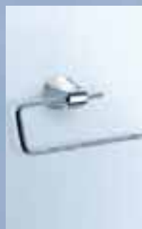
Handtuchring starr, rechts offen, 010-7114