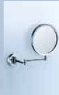
Kosmetikspiegel wandhängend, 019-1195