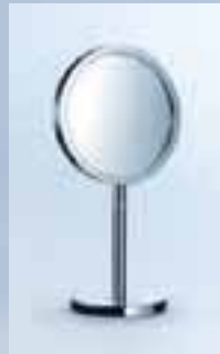
Kosmetikspiegel als Standmodell, 019-1196