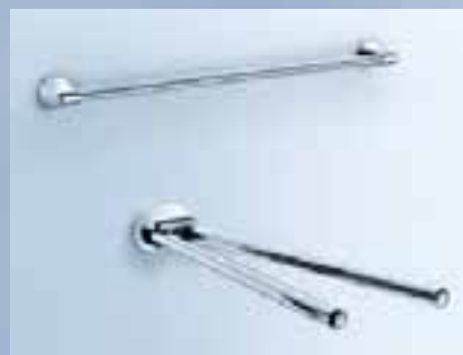
Badetuchhalter, 600 mm, 010-7116, 800 mm, 010-7115; Handtuchhalter, L 360 mm, 010-7119, L 460 mm, 010-7113