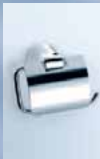
Papierhalter mit Deckel, 010-7106