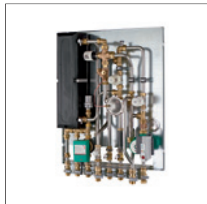
pewoTherm T50 – kompakte Energiezentrale zum Austausch von Gasboilern für zentrale Heizung und dezentrale Trinkwassererwärmung

Versorgt das Gerät auch die Raumheizung, können Raumtemperatur und Nutzungszeiten mit einem entsprechenden Regler individuell programmiert werden. Die Messgeräte sind in der Lage, den Wärme- und Wasserverbrauch jeder Wohnung exakt zu erfassen.