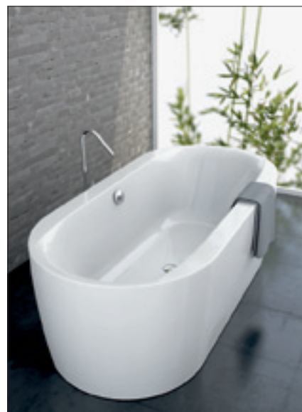
FOX – Ovalwanne