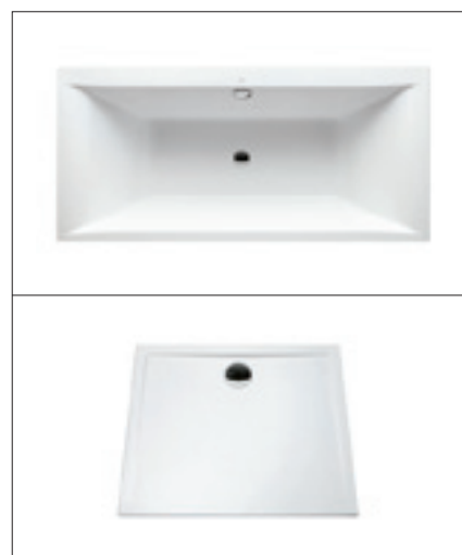
LIFE – Badewanne, Duschwanne