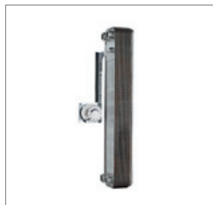
PEWO TFS – das technisch überlegene Trinkwassererwärmungssystem