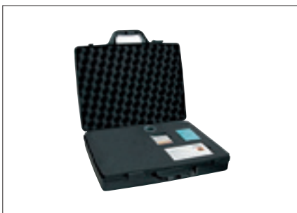
Grünbeck – Analyse-Set basic (Heizung)

In den letzten Jahren hat sich die Technik der Wärmeerzeugung deutlich verändert. Damit einher gehen auch höhere Anforderungen an die Wasserqualität für Heizsysteme. Denn kompakte Kesselanlagen mit kleinen Wärmeübertragern und hohen Temperaturen sind besonders anfällig für Kalkablagerungen, die sich immer an der heißesten Stelle in der Anlage bilden. Da in modernen Mehrkesselanlagen die Wärmeleistung auf mehrere Wärmeerzeuger verteilt wird, sind immer häufiger kleine Wärmetauscherflächen hohen Temperaturen und großen Wassermengen ausgesetzt. Der Kalkbelag wirkt isolierend und es kommt zu einem lokalen Wärmestau. Die dadurch ausgelösten mechanischen Spannungen können über Spannungsrisskorrosion bis hin zum Kesselschaden führen.