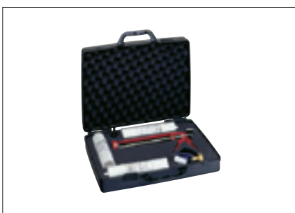
Grünbeck – Service-Set 1 (Konditionierung)

Als Heizungsinstallateur haben Sie es in der Hand, Heizungsanlagen nachhaltig vor ihrem Erzfeind Kalk zu schützen. Die Firma Grünbeck bietet neben verschiedenen praktischen Produkten wie dem Analyse-Set basic (Heizung) und dem Service-Set 1 mit dem Korrosionsinhibitor und Härtestabilisator GENO®-safe A für den Einsatz in Warmwasserheizungsanlagen auch die Enthärtungsanlage HEH 9 an. Die mobile Vorrichtung wird manuell bedient und stellt enthärtetes Heizungsbefüll- und Ergänzungswasser her. Sie besteht aus flexiblen Verbindungsschläuchen, einer Enthärterpatrone mit Austauschharz, einem Probegehäuse, der Dosierstelle für die Zugabe von GENO®-safe A und der Wasserprüfeinrichtung für die Gesamthärte des Wassers. Ihren Platz hat die Enthärtungsanlage in der Kaltwasserleitung unmittelbar vor dem Füllhahn. Bei einer Ausgangswasserhärte von 20° dH kann sie problemlos 900 Liter Weichwasser mit 0° dH erzeugen.