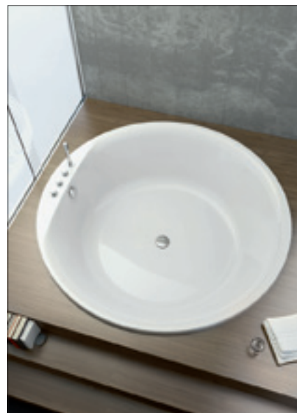
FOX – Rundwanne

Wie alle GKI-Produkte sind auch die neuen Bade- und Duschwannen mit NACRYplus® veredelt, so dass Schmutz, Kalk und andere Fremdstoffe an der Oberfläche nicht haften bleiben. Das erleichtert Ihren Kunden die Reinigung und Ihnen das Verkaufsgespräch.