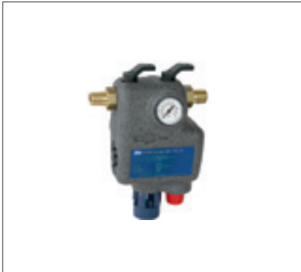
Concept – FüllCombi BA plus DN 20

In unserer letzten Ausgabe berichteten wir in der Rubrik »Sanitär« ausführlich über die neue Trinkwasserverordnung (TrinkwV) vom 01.11.2011. Der Artikel stieß auf großes Interesse bei Ihnen, rief aber auch etliche Fragen hervor. Wir widmen uns diesem komplexen Thema daher heute noch einmal von der Heizungsseite, denn auch hier geht nichts ohne Wasser. Wir haben zusammengetragen, was Sie beachten müssen und welche Neuheiten Erleichterung versprechen.