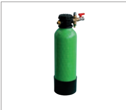
Grünbeck – Enthärtungsanlage HEH 9

In unserer letzten Ausgabe berichteten wir in der Rubrik »Sanitär« ausführlich über die neue Trinkwasserverordnung (TrinkwV) vom 01.11.2011. Der Artikel stieß auf großes Interesse bei Ihnen, rief aber auch etliche Fragen hervor. Wir widmen uns diesem komplexen Thema daher heute noch einmal von der Heizungsseite, denn auch hier geht nichts ohne Wasser. Wir haben zusammengetragen, was Sie beachten müssen und welche Neuheiten Erleichterung versprechen.