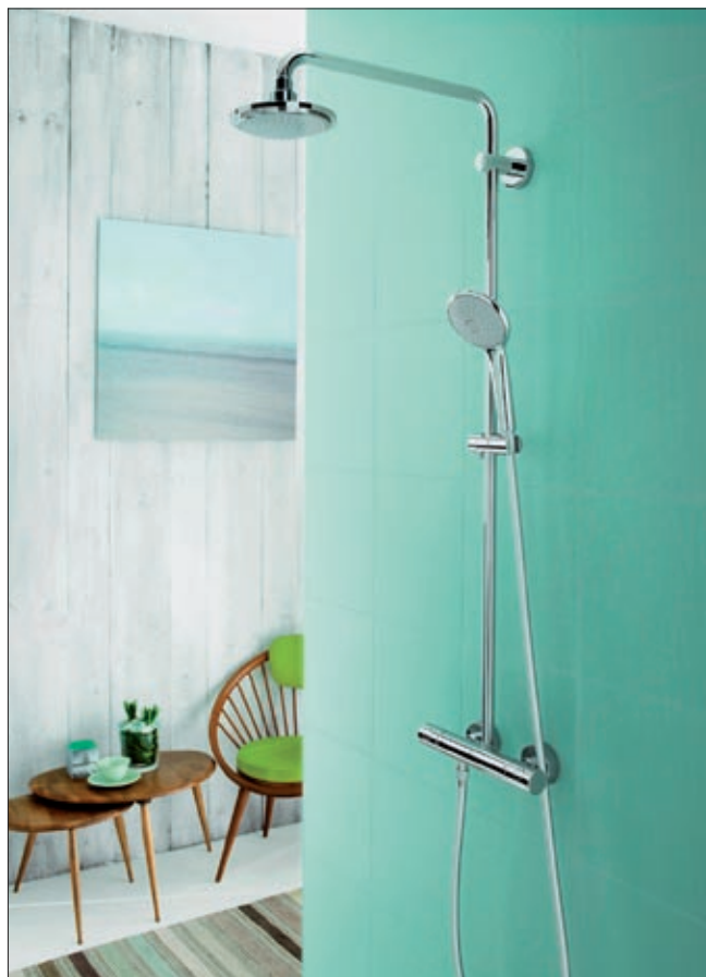
GROHE Euphoria Duschsystem

Wie die Armaturen verfügen auch die Duschsysteme über GROHE EcoJoy® (Reduzierung des Wasserverbrauchs auf 9,4 l/min), GROHE StarLight® und GROHE QuickFix™. Für die perfekte Verteilung des Wassers auf alle Düsen sorgt GROHE DreamSpray®, während GROHE CoolTouch® sicher stellt, dass die Oberflächen der Brausestange und die Brausen selbst nie heißer werden als die eingestellte Wassertemperatur.