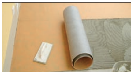
PCI Pecilastic® U einlegen...