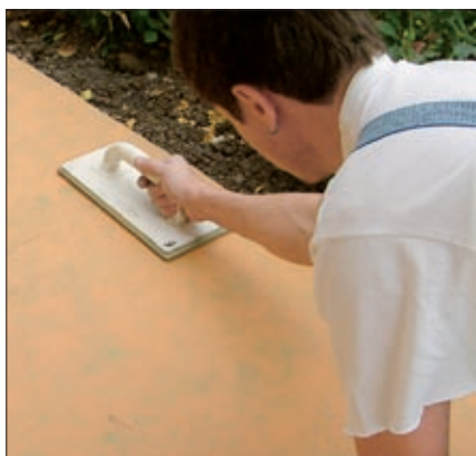
Mit einem Hartgummi-Fugbrett andrücken und anschließend die Stöße der PCI Pecilastic® U-Bahnen mit PCI Pecitape abdichten

Pecilastic® U ist ein neues Mitglied der seit 2006 im Handel erhältlichen Produktfamilie Pecilastic®, zu der die flexible Abdichtungsbahn Pecilastic® W und die selbstklebende Abdichtungsbahn Pecilastic® WS gehören. Es besteht aus einer beidseitig vlieskaschierten Polyethylenfolie und haftet in beide Richtungen: an dem auf den Untergrund aufgetragenen Verlegemörtel sowie an dem auf der Bahn verlegten Keramikbelag. Fußbodenarbeiten sowohl in Bestands- als auch in Neubauten werden dadurch enorm beschleunigt. Davon profitieren nicht nur Sie, sondern auch Ihre Kunden, die sich zudem noch über eine Reduzierung des Raum- und Trittschalls in den entsprechenden Bereichen freuen können.