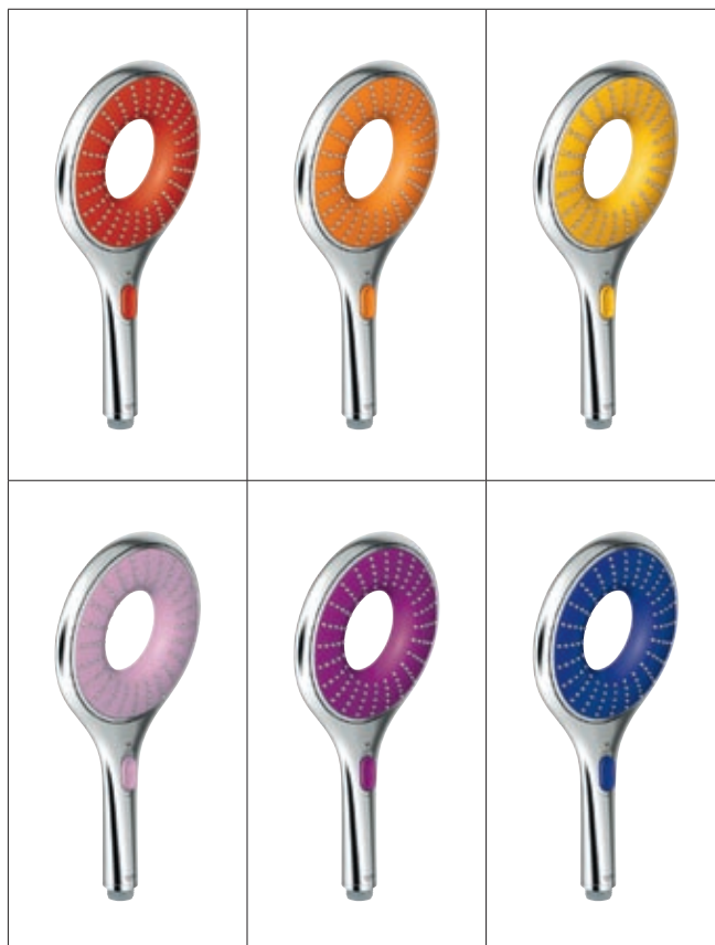
GROHE Rainshower® Rainbow Collection

Selbstverständlich können Sie alle GROHE Neuheiten schon jetzt bei uns beziehen.