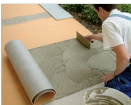
Auf dem vorbereiteten Untergrund PCI Flexmörtel, PCI Nanolight oder PCI Nanoflott light aufkämmen...

»Arbeiten und sparen macht zusehends reich.«, sagt ein altes deutsches Sprichwort. Müsste die Firma PCI es neu erfinden, würde es wohl lauten: »Nicht arbeiten und dabei sparen macht zusehends reich.« Denn das neue Material Pecilastic® U dient sowohl zur Abdichtung als auch Entkopplung bei der Verlegung von Keramikböden. Sie sparen sich also einen Arbeitsgang und zusätzliches Material.