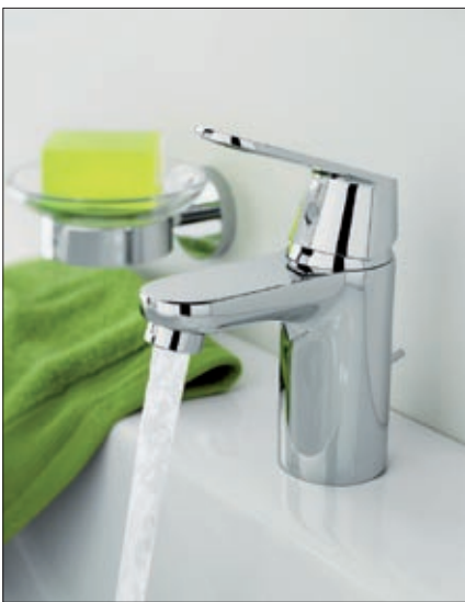
GROHE Eurosmart Cosmopolitan Waschtischarmatur

Hurra, der Storch war da. Genauer gesagt, müssen es wohl gleich mehrere gewesen sein, die dem Hause GROHE einen Besuch abgestattet haben. Denn das GROHE Sortiment ist seit kurzem um mehrere Errungenschaften reicher. Von der Armatur über Duschsysteme bis hin zu Handbrausen ist alles dabei, so dass die Herren Adebare ziemlich schwer geschleppt haben müssen. Wir gratulieren und möchten Ihnen Gelegenheit geben, einen Blick auf die Neuheiten zu werfen.