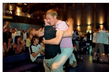
Bilder von unserem EM-Studio 2008