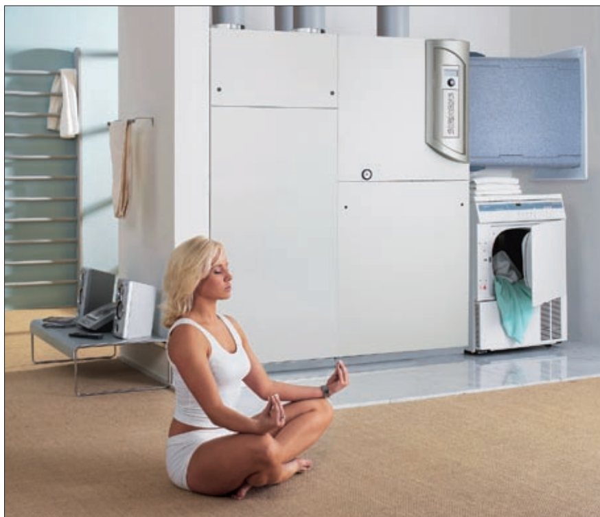
Die neue Siemens Haustechnikzentrale HLW aus dem Hause Novelan

Auch hier profitiert der Nutzer vom neuesten Forschungsstand, denn die Geräte arbeiten nach dem Prinzip der doppelten Wärmerückgewinnung und sorgen so für eine noch höhere Energieausbeute. Bei kalten Außentemperaturen wird die ungenutzte Energie, die in der Abluft aus der Lüftungsanlage noch enthalten ist, über den Luftansaugkanal der Wärmepumpe geführt. Dadurch steigt die Luftansaugtemperatur der Wärmepumpe, was wiederum zu einer »spürbaren« Erhöhung der Anlageneffizienz führt. Leistungszahlen von bis zu 4,3 sind somit durchaus realistisch.