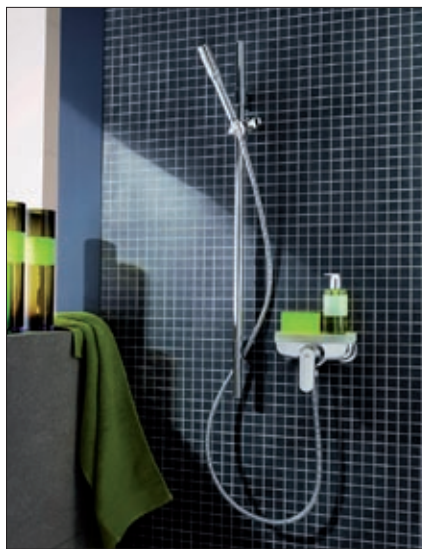
GROHE Eurosmart Cosmopolitan Duscharmatur