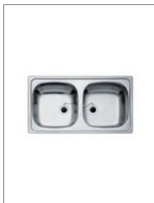
TEKA Auflage-Doppelbecken 100 x 60 cm ohne Ablage, Edelstahl, inklusive Ab- und Überlaufgarnitur (noch 90 Stück verfügbar)