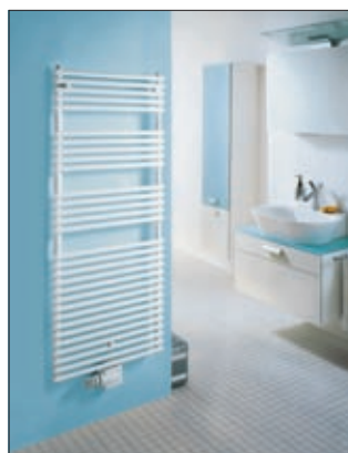
Zehnder Design-Badheizkörper FORMA 1441 x 596 mm, Weiß RAL 9016, Wärmeleistung 668 Watt, Ausführung einlagig (noch 40 Stück verfügbar)