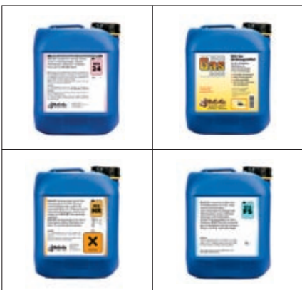
BaCoGa Flüssigdichter für viele Anwendungsbereiche

Um Leckstellen in allen Rohrsystemen des Hauses schnell, sauber und zuverlässig abzudichten, eignen sich besonders Flüssigdichter aus dem BCG-Produktsystem. Die Dichtmittel auf gelöster mineralisch-kristalliner Basis werden mit einer Pumpe in den Wasserkreislauf z. B. der Heizungsanlage eingefüllt und dichten dort in kürzester Zeit selbsttätig – von innen nach außen – die Schadstelle durch Verkieselung ab. Dauerhaft. Ebenfalls gut zu wissen, gerade in Rekordwintern: Die Heizung muss während dieser Prozedur nicht mal ausgeschaltet werden. Mit den Produkten der Firma BaCoGa Technik GmbH können Sie nicht nur Risse in Rohren, sondern auch Lochfraß in Heizkesseln, undichte Fußbodenheizungen und defekte Lötstellen ausbessern.