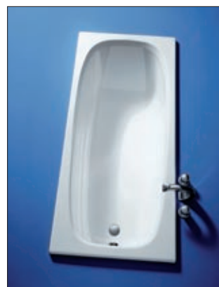
Koralle Badewanne Normaline 1605 x 705 mm, Weiß, inklusive Wannenträger (noch 60 Stück verfügbar)