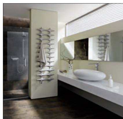
Kermi Designheizkörper Ideos