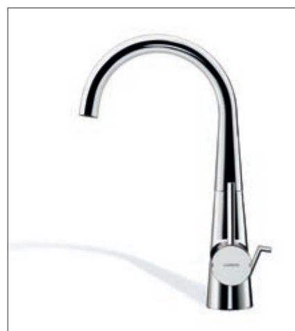
HANSADESIGNO als geschwungene Variante für Aufsatz-Waschtisch