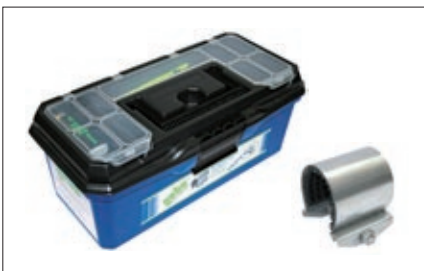
Gebo Unifix Mini-Box

Eine schnelle und kostengünstige Lösung für undichte Rohre sind Schutzbandagen aus Polyesterweben, die bei der Herstellung mit Polyurethanharzen getränkt wurde. Die Bandage wird in Wasser aktiviert und dann straff um die undichte Stelle gewickelt, wobei das austretende Harz mit den Händen in die Bandage eingearbeitet wird. Schon nach 30 Minuten ist das Rohr wieder mit vollem Druck belastbar. Sie erhalten die Bandage als Rohr-Reparatur-Set zusammen mit Schutzhandschuhen und Montageanleitung in unseren Abhollagern.