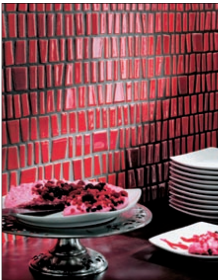
Mosaik »I Toki« Kollektion Atlante, Rosso Siso

Einen Großteil seiner Erfahrung hat Ceramica di Treviso in das Warenzeichen »TrevisoProgetta« gesteckt. Es steht für die handwerkliche Herstellung von Emaille, Schamotte und Einrichtungselementen für das Bad sowie kunsthandwerkliche Dekorteile. Seinen Einstand gab das neue Warenzeichen mit dem Badezimmerprojekt SISO®, das die Ausdrucksmöglichkeiten von Tonmosaiken auslotet. Ergänzt wird es durch die Kollektion »I Toki«, mit der Designer Toto Dolfato das Tonmosaik neu interpretiert. Sie besteht aus ungleichmäßigen Tonstücken, die manuell in unregelmäßigen Reihen auf Netzfolien von 30 x 30 cm Größe angeordnet werden. Diese sind schnell und praktisch zu verlegen und erzeugen durch die Zufälligkeit der Positionierung ein einmaliges Stück Kunsthandwerk. »I Toki« ist entweder in natürlichem Ton gehalten oder emailliert und eignet sich als Wandschmuck ebenso wie für die Verlegung als Bodenbelag.