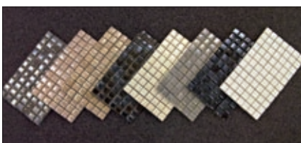
Serie »Mosaico Loft«, exklusiv bei BF

Die einzigartigen Kollektionen, die Farbtiefe der Emaille und die faszinierend gestalteten Oberflächen der Mosaikteile sind der Liebe zum Detail zu verdanken, mit der Ceramica di Treviso alle Schritte plant. Die Fachabteilung TrevisoProgetta führt intensive Forschungsarbeiten zu allen Fragen der Gestaltung und Produktion durch, die Farbpigmente werden in den eigenen Labors hergestellt und die Oberflächen von Hand bemalt oder eingeritzt. Auch die Einbrennung mit hohen Temperaturen in Muffelöfen in Zyklen von 24 Stunden trägt dazu bei, Produkte von hoher ästhetischer Qualität zu erzeugen.