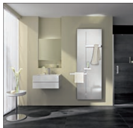
Kermi Wohnheizkörper Fedon