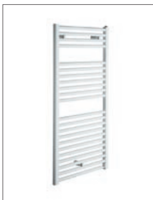
BEMM Badheizkörper BMS 1720 x 600 mm, Weiß RAL 9016, Wärmeleistung 690 Watt (noch 30 Stück verfügbar)