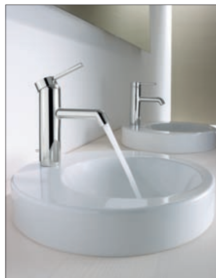
HANSADESIGNO Waschtischarmatur mit Side Aufsatz-Waschtisch

Auch Armaturen müssen mit der Zeit gehen. Gefragt sind Designs, die sich in die Architektur einfügen, aber trotzdem Charakter haben. Neue Raumlösungen wie zum Beispiel Aufsatz- und Wand-Waschtische stellen ebenfalls völlig neue Ansprüche an Armaturen. Hansa antwortet auf diese Herausforderungen mit einem Design-Klassiker im neuen Outfit: HANSADESIGNO.